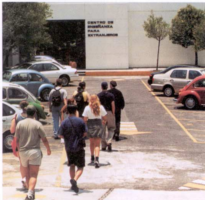
Le voyage d'études de fin d'année du groupe étudiant le français, l'anglais et l'espagnol comprend une visite au Centre d'études des langues mexicaines à l'Université de Mexico.